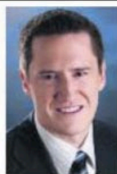
BENOIT CHARETTE Député de Deux-Montagnes

Adresse de circonscription 15, chemin de la Grande-Côte, bureau 105 Saint-Eustache (Québec) J7P 5L3 Tél: 450-623-4963 Téléc: 450-623-7178 Courriel: bcharette@assnat.qc.ca www.benoitcharette.org