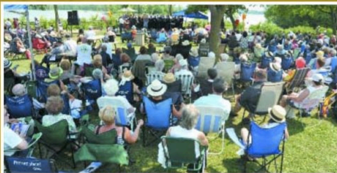
Plusieurs personnes se sont rassemblées sur la Promenade Paul-Sauvé pour venir écouter gratuitement le concert viennois qui y était présenté comme spectacle de fermeture du Festival.

Conseil Arts et Culture de Saint-Eustache