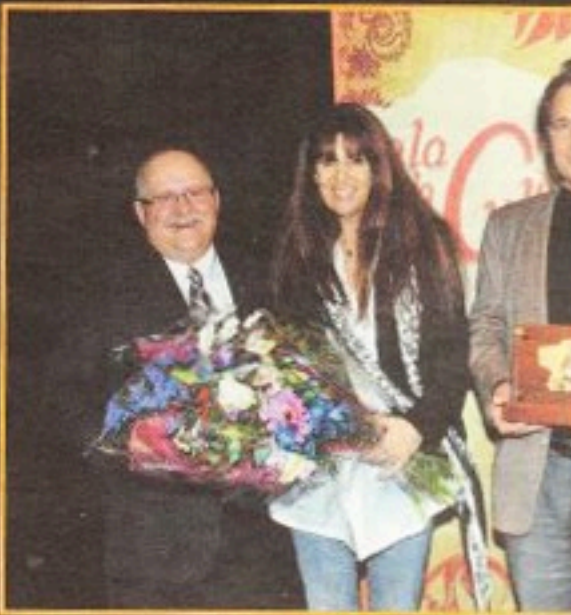
L'École de théâtre du Vieux Saint-Eustache, dirigée par Stefano Corbo, a fait l'objet de l'hommage spécial illustré par la diffusion ou la promotion d'œuvres liées à la vie culturelle eustachoise.

Texte: Jean-François Carignan